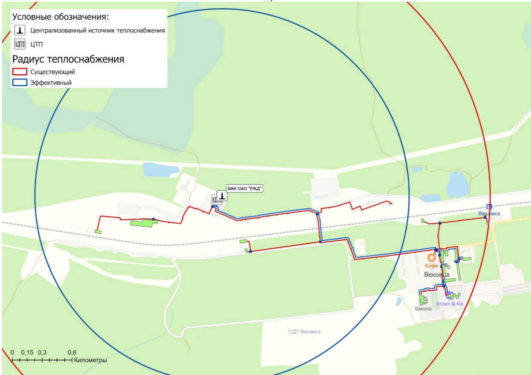
Рисунок 2.5.1 - Радиусы теплоснабжения (существующий и эффективный) системы теплоснабжй ст. Веовка