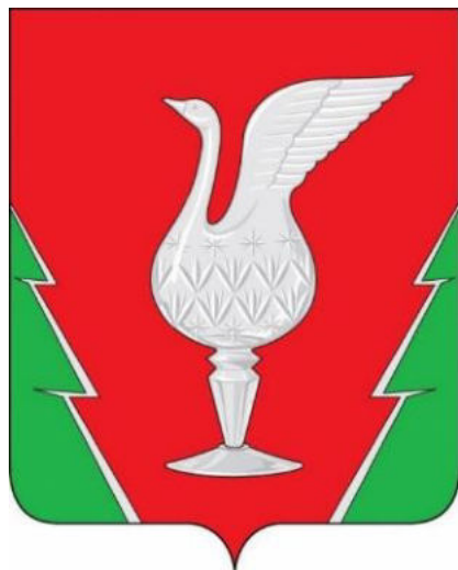
СХЕМА ТЕПЛОСНАБЖЕНИЯ МУНИЦИПАЛЬНОГО ОБРАЗОВАНИЯ ПОС. ВЕЛИКОДВОРСКИЙ (СЕЛЬСКОЕ ПОСЕЛЕНИЕ) ГУСЬ-ХРУСТАЛЬНОГО РАЙОНА ВЛАДИМИРСКОЙ ОБЛАСТИ ДО 2027 ГОДА (АКТУАЛИЗАЦИЯ ПО СОСТОЯНИЮ НА 2023 ГОД)